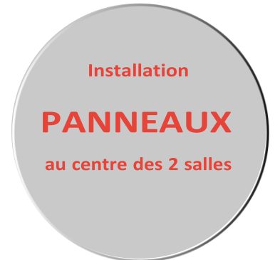
SCHÉMA DES PANNEAUX POUR LES KIOSQUES AU CENTRE DES DEUX SALLES